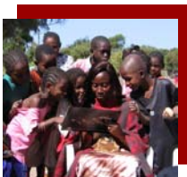
Année 2006 échanges de correspondance entre deux classes à Mbodiène et Toulouse

- aider les jeunes enfants à être scolarisés et contribuer à la formation des jeunes.